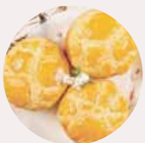
菠蘿奶黃飽 PINEAPPLE EGG CUSTARD BUN, BÁNH KEM TRỨNG DỪA - M