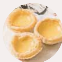
酥皮蛋撻 EGG CUSTARD TART, BÁNH TRỨNG SỮA - S