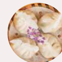
潮州粉果 CHAO ZHOU DUMPLING, BÁNH BAO PHONG CÁCH CHAO CHAU - L