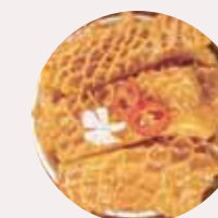
牛肚 BEEF TRIPE, GÂN THỊT BÒ - L