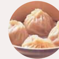
小籠飽 SHANGHAI PORK DUMPLING, BÁNH BAO THỊT LỢN THƯỢNG HẢI - XL