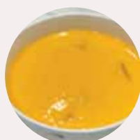
芒果布甸 MANGO PUDDING, PUDDING XOÀI - L