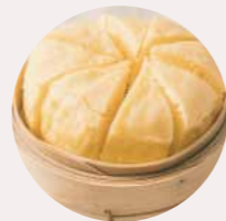
馬拉糕 SPONGE CAKE, BÁNH XÓP - M