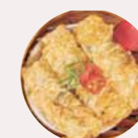
鮮竹卷 BEAN CURD ROLL WITH PORK, CUỘN ĐẬU ĐÔNG THỊT HEO - L