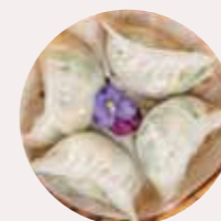
韭菜餃 (I) CHIVES & PRAWN DUMPLING, BÁNH BAO TÒM TỎI HẸ - XL