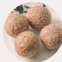
紫薯煎堆 PURPLE SWEET POTATO BALL, KHOAI LANG TÍM BI - M