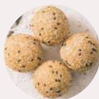
黑芝麻煎堆 BLACK SESAME BALL, MÈ ĐEN BI - M