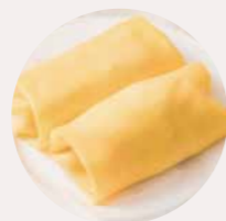
芒果班戟 MANGO PANCAKE, BÁNH XÈO XOÀI - L