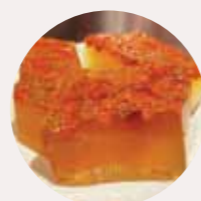
杞子桂花糕 HERBAL JELLY, THẠCH THẢO DƯỢC - M